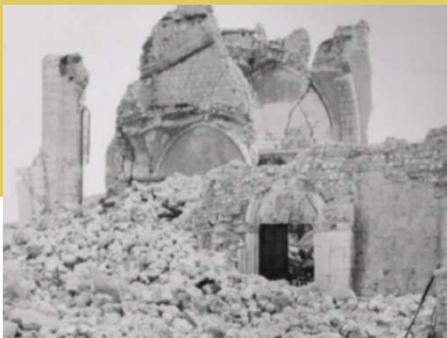
DUOMO DI VENZA PRIMA E DOPO IL TERREMOTO