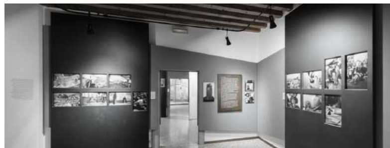
VENZONE - MUSEO TIERE MOTUS