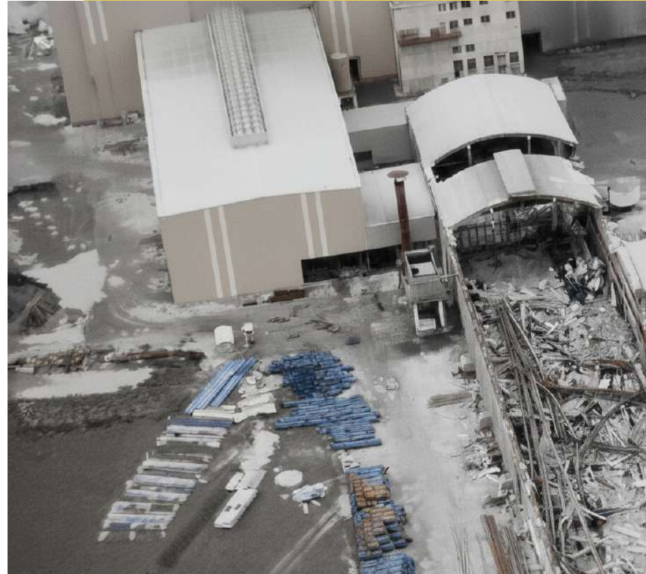
OSOPPO - FABBRICA PITTINI

Artegna: Situata sulla linea di faglia, subì danni strutturali gravissimi sia al patrimonio civile sia a quello produttivo, isolando di fatto la zona industriale dai collegamenti principali.