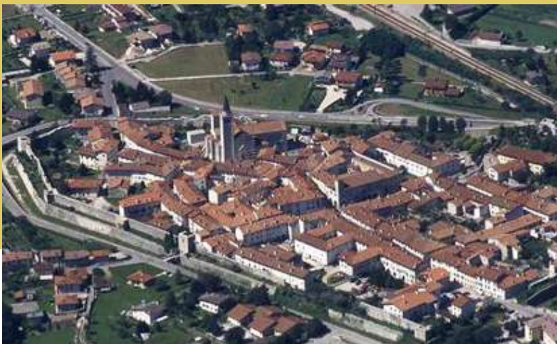
VENZONE - PRIMA E DOPO