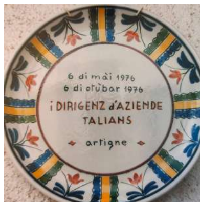
PIATTO DEL RICORDO