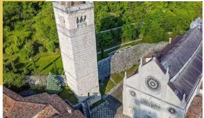
DUOMO DI GEMONA - PRIMA E DOPO